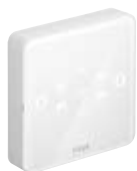
卫生助手， 白色版 编号 2245.60