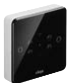
卫生助手， 黑色版 编号 2245.60

目前卫生助手有黑色和白色可供选择。按照实际情况可以选择与合适的多功能感应器一起安装：适用于德房家内螺纹三通接头（暗装）。