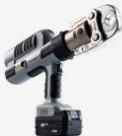
安装工具 - 德房家卡压枪