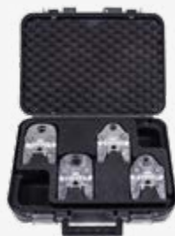
安装工具 - 德房家卡压钳及卡压环模